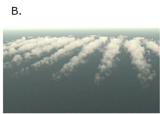
Figure 3 : A. Photo vue de face du parc de Hors Rev. B. Simulation numérique [4]

Pour déterminer les conditions atmosphériques à l'origine du phénomène, les équipes partenaires ont mené une véritable enquête en s'appuyant sur la date et l'heure à laquelle la photographie avait été prise ainsi que sur des données collectées dans le cadre d'une étude réalisée en 2013 [3] qu'elles ont complété par l'analyse de données supplémentaires en provenance de la NASA notamment.