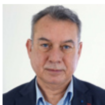
Ouverture par Pierre-Franck Chevet , Président d'IFPEN