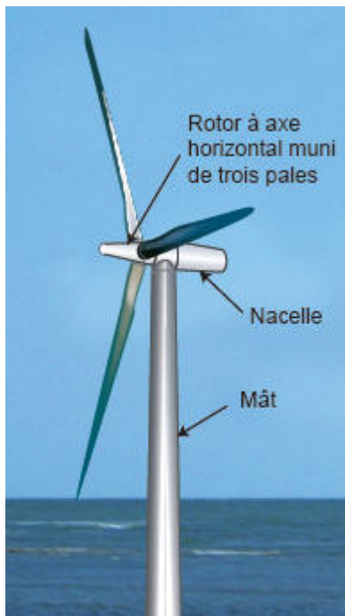
Les composants d'une éolienne

En tournant, le rotor entraîne un générateur qui produit de l'énergie électrique . Dans les éoliennes de conception classique, le générateur nécessite une vitesse de rotation entre 1 000 et 2 000 tours par minute, alors que les pales tournent plus lentement (entre 5 et 25 tours par minute). Dans ces éoliennes, un multiplicateur (ou boîte de vitesse) est installé entre le rotor et le générateur pour augmenter la vitesse de rotation. Il existe aussi des machines de conception plus récente, à entraînement direct, dont les générateurs fonctionnent avec une vitesse de rotation variable (de 5 tours à 2000 tours par minute) et qui n'utilisent pas de multiplicateur. L'ensemble constitué par le multiplicateur et le générateur forme la nacelle .