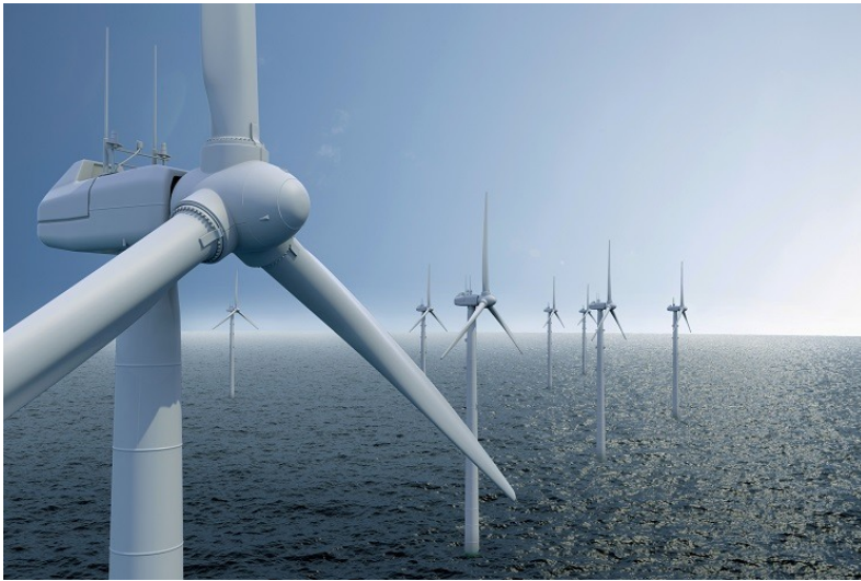
Parc éolien en mer

Au large des côtes, les vents sont plus puissants et plus réguliers qu'à terre , ce qui explique l'envol de l'éolien en mer depuis plusieurs années. Plus grandes et plus puissantes (6 à 10 MW, voire 18 MW pour certains modèles récents), les éoliennes installées en mer fournissent plus d'énergie par machine que les éoliennes terrestres. Elles ont un impact limité sur le paysage, ce qui permet de déployer des parcs de taille plus importante, avec un plus grand nombre d'éoliennes. Les coûts de fabrication, d'installation et de production sont plus élevés qu'à terre mais ils sont amenés à diminuer d'année en année.