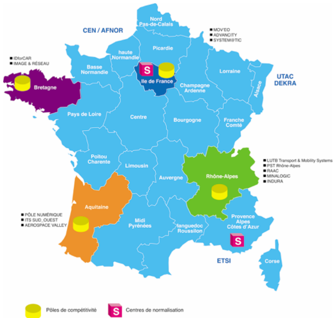
Fig. 3 – Carte des acteurs publics les plus actifs dans les ITS (septembre 2017)

Au niveau national, les actions publiques de développement des ITS se concentrent autour de quatre régions très actives (fig. 3). Les acteurs se partagent entre académiques, instituts de recherche, pôles de compétitivité, centres de certification, etc.