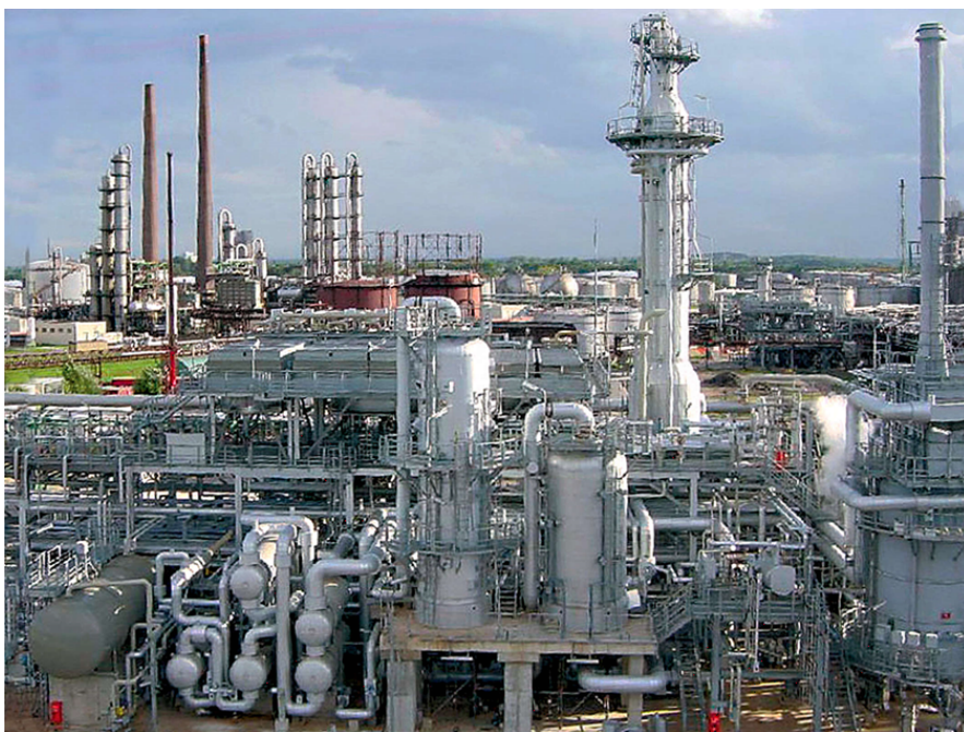
Unité Prime G+

En 2021, 300 références Prime-G+® dans le monde contribuent à la production d'essence très basse teneur en soufre conforme aux réglementations environnementales les plus strictes.